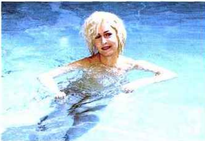
Dominique Gonzalez-Foerster, Sans titre , 2015, photographie préparatoire.

Artiste majeure de la scène internationale, Dominique Gonzalez-Foerster explore les relations entre réalité et fiction sous forme de performances, de photographies et de films. Le Centre Pompidou consacre à l'artiste